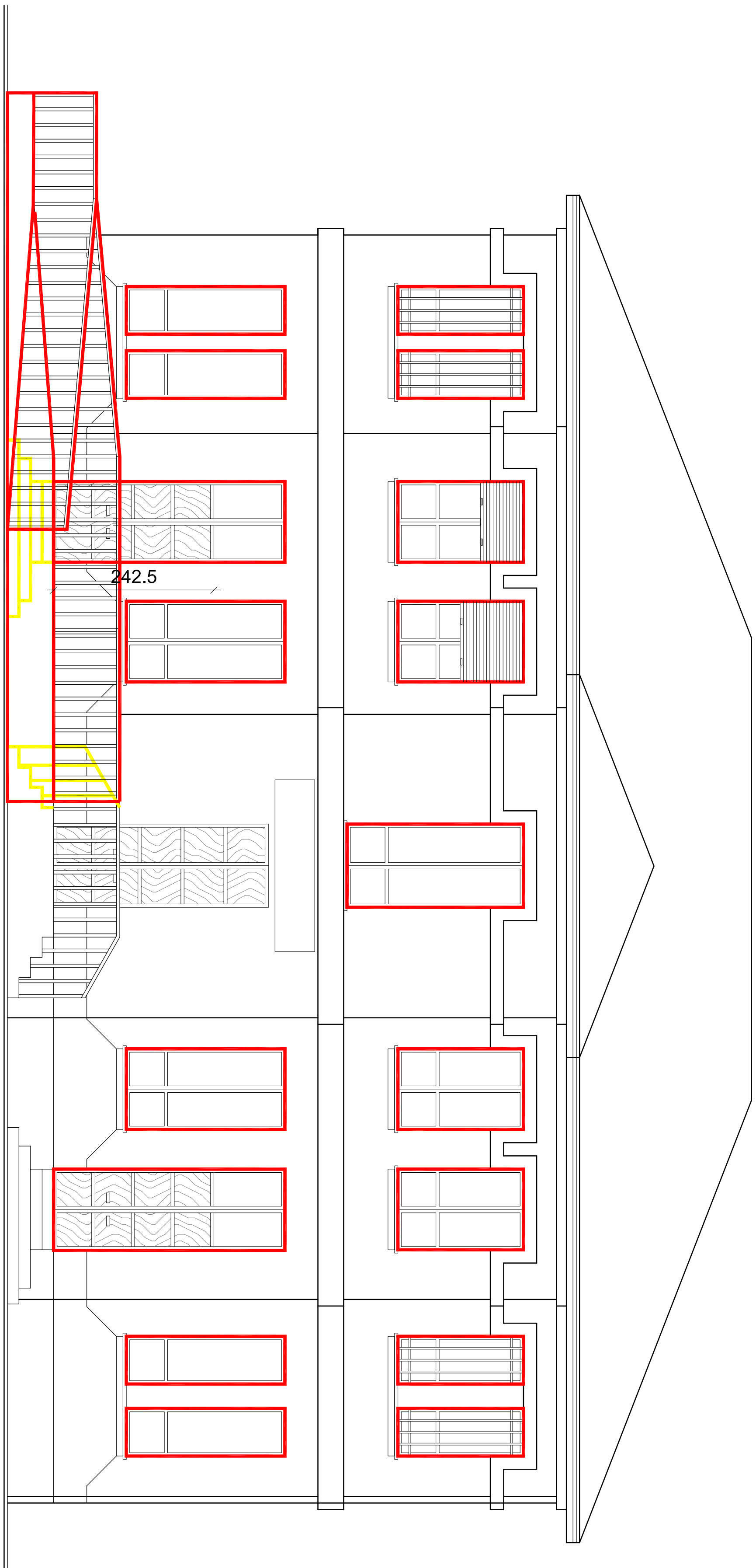
PROSPETTO OVEST - scala 1:50