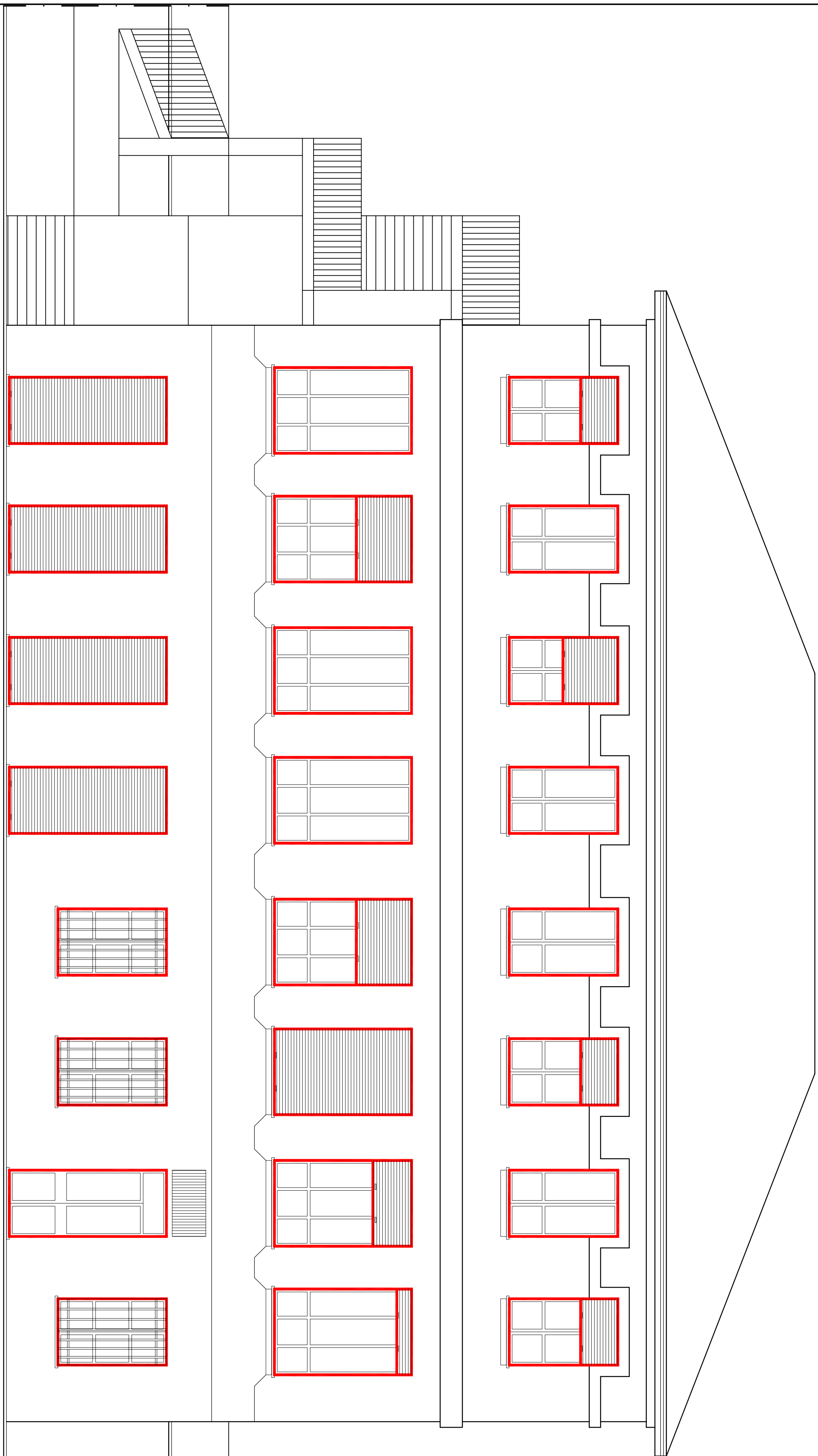
PROSPETTO EST - scala 1:50